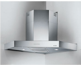
Campana extractora Pitagora